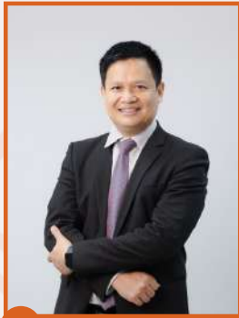
ผู้ช่วยศาสตราจารย์อุปสอ รองคณบดี กรรมการ