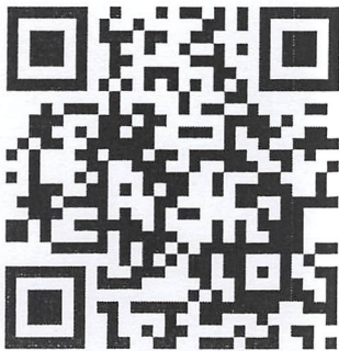
QR code ลงทะเบียน

จึงเรียนมาเพื่อโปรดให้ความอนุเคราะห์ประชาสัมพันธ์ ในหน่วยงานของท่าน ให้ทราบโดยทั่วกัน รวมทั้ง สนับสนุนบุคลากรที่สนใจเข้าร่วมโครงการในครั้งนี้ จักเป็นพระคุณอย่างยิ่ง