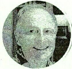
Rob Waring Extensive Reading Foundation