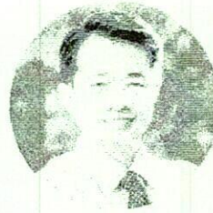
Dumrong Adunyarittigun Thammasat University