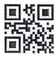
รายละเอียดและแบบฟอร์มใบสมัคร