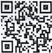
เว็บไซต์วารสาร