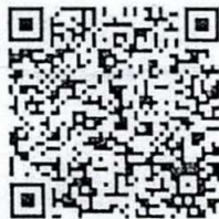
แบบฟอร์มบทความ