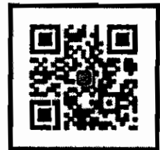
Line QR Code