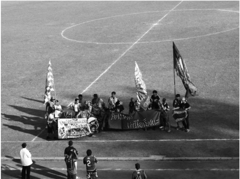
รูปที่ 3 การแลกของที่ระลึกระหว่างพักครึ่งเวลา

ความสัมพันธ์และกิจกรรมที่แฟนต่างสโมสรทำร่วมกันจนเป็นธรรมเนียมปฏิบัตินี้ช่วยสร้างความสัมพันธ์ที่ดีระหว่างแฟนบอลแต่ละสโมสร ทำให้ช่วยลดโอกาสที่จะเกิดความบาดหมางระหว่างแฟนต่างสโมสรได้มาก ผู้เขียนเคยถามชาวต่างชาติหลายคนที่เป็นแฟนบอลไทยว่าพวกเขาประทับใจอะไรในฟุตบอลไทยมากที่สุด เกือบทั้งหมดตอบตรงกันว่าสิ่งที่พวกเขาประทับใจในฟุตบอลไทยมากที่สุดคือความเป็นมิตรที่แฟนบอลทั้งสองฝ่ายมีต่อกัน ดังที่จะเห็นได้ว่าบรรยากาศก่อนการแข่งขันในทุกสนามนั้นแฟนบอลสองฝ่ายจะเป็นมิตรต่อกันมากและไม่เคยปรากฏเหตุการณ์รุนแรงมาก่อนเลย 29