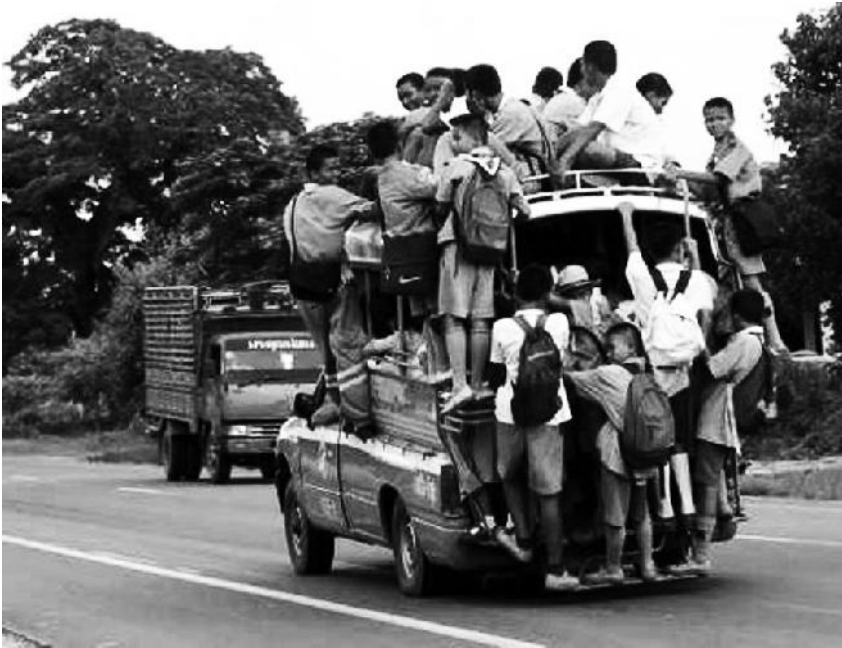
รูปที่2 รถรับส่งนักเรียนในชนบท