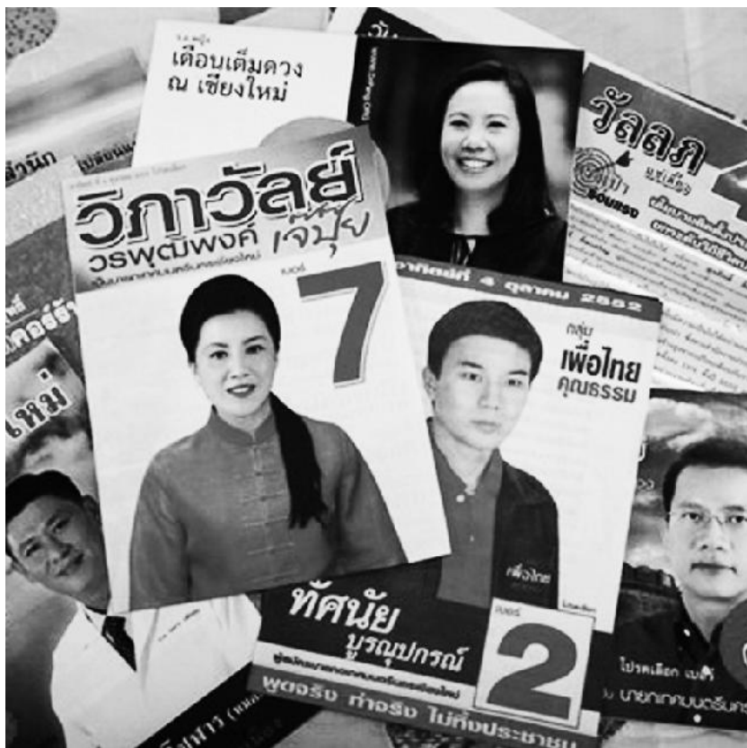
รูป2 แผ่นพับหาเสียงนายกเทศมนตรีนครเชียงใหม่ในปี 2552

สามารถกำหนดตัวผู้บริหาร และขยายพื้นที่ทางการเมืองของประชาชนออกไปอย่างกว้างขวาง