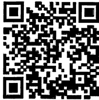
QR code สำหรับลงทะเบียน

ผู้ที่มีความประสงค์ร่วมนำเสนอผลงานวิจัยสามารถลงทะเบียนสมัครได้ที่ https://research.kpru.ac.th/std-conference๔/ หรือทาง QR code ที่อยู่ด้านล่างนี้ โดยชำระค่าลงทะเบียนหลังการส่งบทความเข้าระบบ เพื่อเป็นการยืนยันการส่งบทความให้พิจารณาเข้าร่วมการประชุมวิชาการ