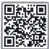
แบบตอบรับเชิญ