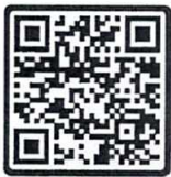
เอกสารแนบ 1