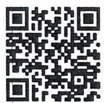
ส่งผลงานวิชาการ