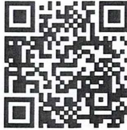
QR code สำหรับลงทะเบียน

ผู้ที่มีความประสงค์ร่วมนำเสนอผลงานวิจัยสามารถลงทะเบียนสมัครได้ที่ https://research.kpru.ac.th/std-conference๓ หรือทาง QR code ที่อยู่ด้านล่างนี้ โดยชำระค่าลงทะเบียน หลังการส่งบทความเข้าระบบ เพื่อเป็นการยืนยันการส่งบทความให้พิจารณาเข้าร่วมการประชุมวิชาการ