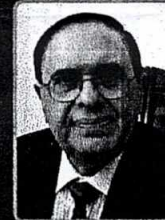
Prof. Atta-ur-Rahman, University of Karachi, Pakistan