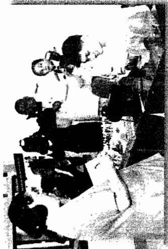
สมเด็จพระเทพรัตนราชสุดาฯ สยามบรมราชกุมารี เสด็จทอดพระเนตรกิจกรรมด้านอาชีพคนพิการทางสติปัญญา