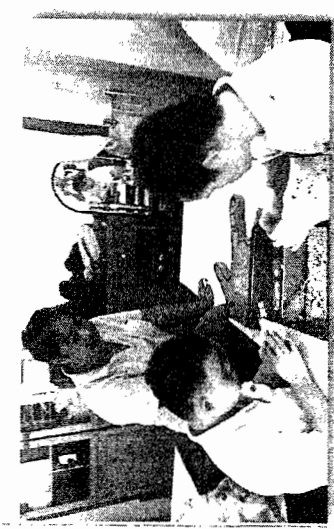
การเสริมสร้างพัฒนาการ (การใช้กล้ามเนื้อมัดเล็ก)