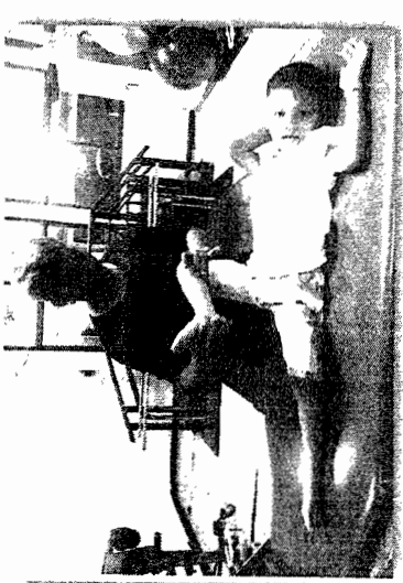
กายภาพบำบัด