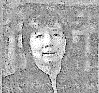
Siti Mina Tamah Widya Mandala Catholic University, Indonesia

For more details and registration, please visit www.culi.chula.ac.th/research